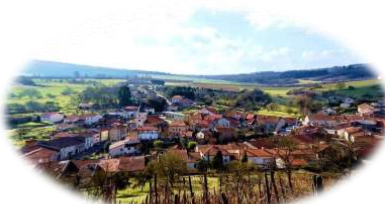
Viterne s'éveille ... JM. Nuel

" Un bon arbre peut loger dix mille oiseaux "