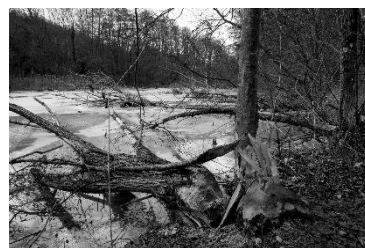
Atelier photos Familles Rurales - exposition septembre 2017 – par Mme Christine Najotte