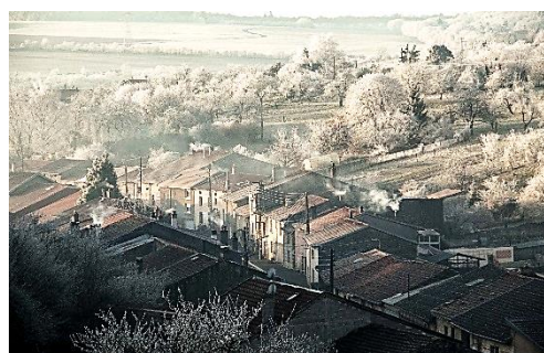
Viterne "nid douillet"