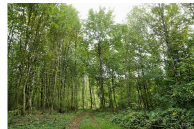
La gestion forestière doit être respectueuse de l'environnement.

Concernant le réaménagement de la carrière de Bainville-sur-Madon, le conseil a donné un avis favorable à un projet ambitieux. Ce dernier prévoit une restauration écologique avec la création de nouveaux habitats pour la faune et une végétalisation accrue, annonçant une exploitation respectueuse de l'environnement pour les 30 prochaines années. ■