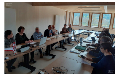
La réunion du 14 mars dernier a placé autour de la table des représentants de l'État, de la multipôle Sud Meurthe-et-Moselle, ainsi que des territoires voisins.

La CCMM encourage la participation de tous à cette réunion publique de ce jeudi. ■