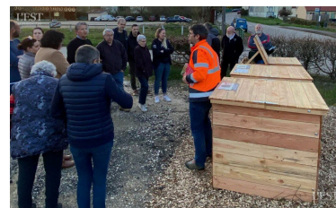
Un 17 e site de compostage partagé inauguré, en présence d'une quinzaine d'habitants.

Toute personne intéressée par cette solution est invitée à s'inscrire en mairie ou contacter la COVALOM : ■